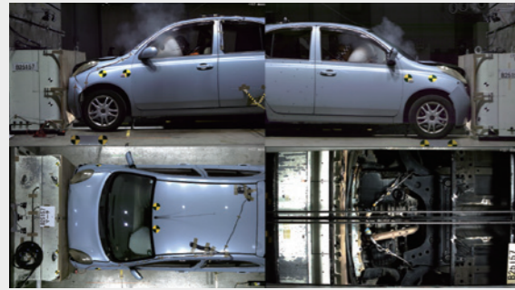
自動車衝突試験(多視点同期撮影)