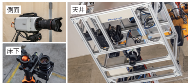
車両全体の挙動を捉えるため、側面・天井・床下にハイスピードカメラを設置して同時に撮影する。

3年ほど前、20年近く使用していた以前のカメラの保守期限が切れるタイミングで入れ替えを検討。フォトロンの製品は展示会や会社訪問で実機を見ていて、ハイスピードカメラによる衝突実験のプロモーション映像の撮影に当社の実験場を使って頂いたというご縁もありました。一方で、検討するに当たっては、改めて各カメラメーカーから情報を集め、ゼロベースで比較検討しました。その結果、私たちが求めている性能、機能のほとんどを網羅していたのがフォトロンのハイスピードカメラでした。