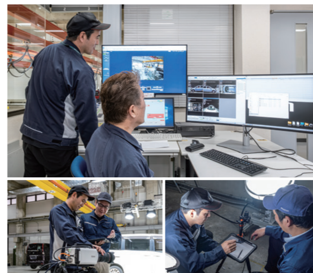
複数のカメラ映像を、1台のモニターで同時に確認が可能。撮影前の画角調整は、モニターから離れた位置でも手元のタブレットで確認可能に。

制御ソフトPFV4(Photron FASTCAM Viewer4)は操作性が非常に優れていて、設定から撮影、映像編集までの一連の流れがストレスフリーになりました。衝突試験では、定置カメラと車載カメラなど複数のカメラでの撮影を要します。これまではカメラ1台につきモニター1台を繋いでいたため、カメラの数だけモニターで確認していました。また撮影前の画角調整は、1台ずつカメラの設置場所で行わなければならない、車体の下部を撮影するカメラは地下ピットに据えるため、その行き来だけでもかなりの時間を要していました。フォトロンのカメラを導入後は、リモートでレンズ制御できるカメラは画角調整を行え、すべてのカメラで照明の点灯状態などを手元のタブレット1台で確認、調整ができるため、その都度移動する手間がなくなりました。